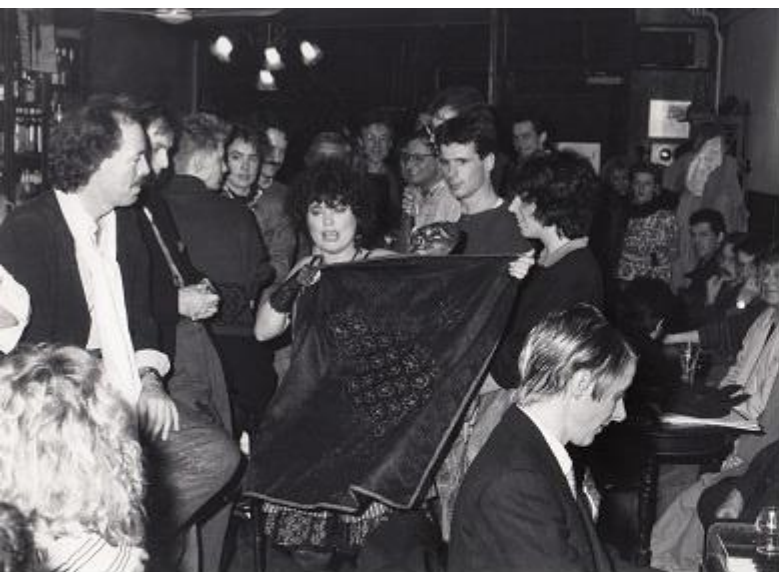
Eigen Theatergroep Mijne Heren! Foto links: 1987. Foto rechts: 1989.