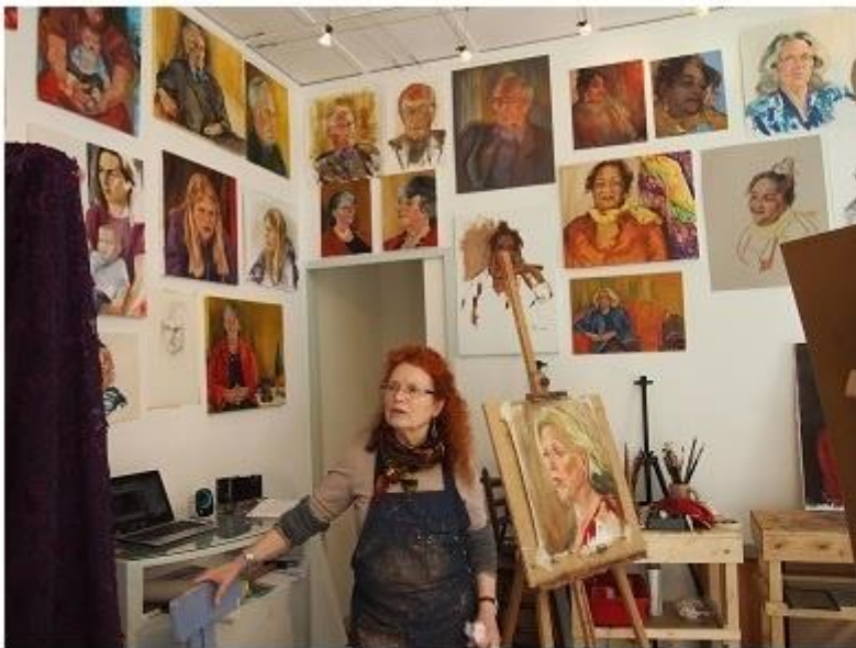
Foto boven: Maroesja in haar atelier. Foto rechts: Boekpresentatie 28 mei 2022.

Op dit moment gebeurt er beeldend niet veel, door dat schrijven. Ik popel wel om weer te beginnen. Toch zal er even weinig tijd voor zijn. Als kleine uitgever - GiST - en debuterende zeventig plusser, zullen we hard aan de weg moeten timmeren om aandacht te krijgen voor De Toveraarsdochter . "Het gevoel nooit te zijn geworden wat we hadden moeten zijn" heeft te maken met het belang van succes in ons gezin. Het werd thuis niet hardop gezegd, maar succes, waar mijn vader zoveel van genoot, stond in hoog aanzien. Wij hadden het gevoel dat nooit te evenaren, het nooit 'gemaakt te hebben'.